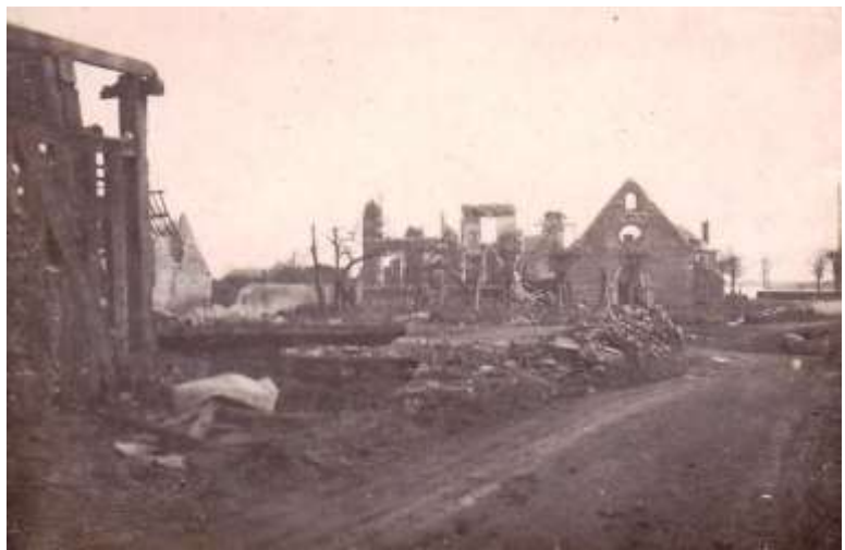
Les restes de l'église et du village après le 6 juillet 1944

Ainsi, notre corpus comprend un ensemble de quatre immeubles ainsi que dix maisons isolées – dont deux ne font pas partie du périmètre de reconstruction –, trois fermes et l'église communale. En considérant que le périmètre de reconstruction contient en lui-même un corpus d'étude restreint, nous avons incorporé des immeubles qui ne font pas partie de ce périmètre et qui concernent les opérations de reconstruction d'un point de vue administratif et formel. Nos recherches ont également repéré l'existence d'un ensemble de logements HLM mis en place dès 1960, mais malgré l'intérêt historique et architectural qu'ils représentent, ils ne seront pas pris en compte dans notre corpus d'étude car leurs dates de construction ne correspondent plus à la période qui nous concerne. Nous nous limiterons cependant à évoquer ces immeubles au cours de nos analyses architecturales et historiques –dans la continuité des programmes de logements prévus à Saint-Père après la fin de la Reconstruction.